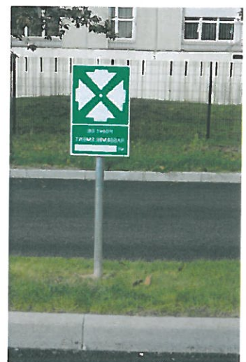
Dans l'allée derrière le panneau