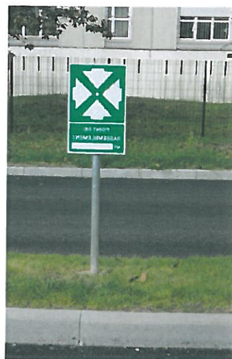
Dans l'allée derrière le panneau